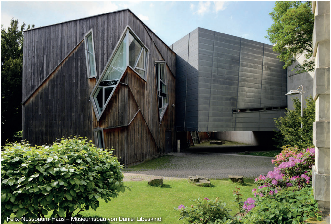
Felix-Nussbaum-Haus – Museumsbau von Daniel Libeskind

wahlrechts unter Aufdeckung der stillen Reserven droht.