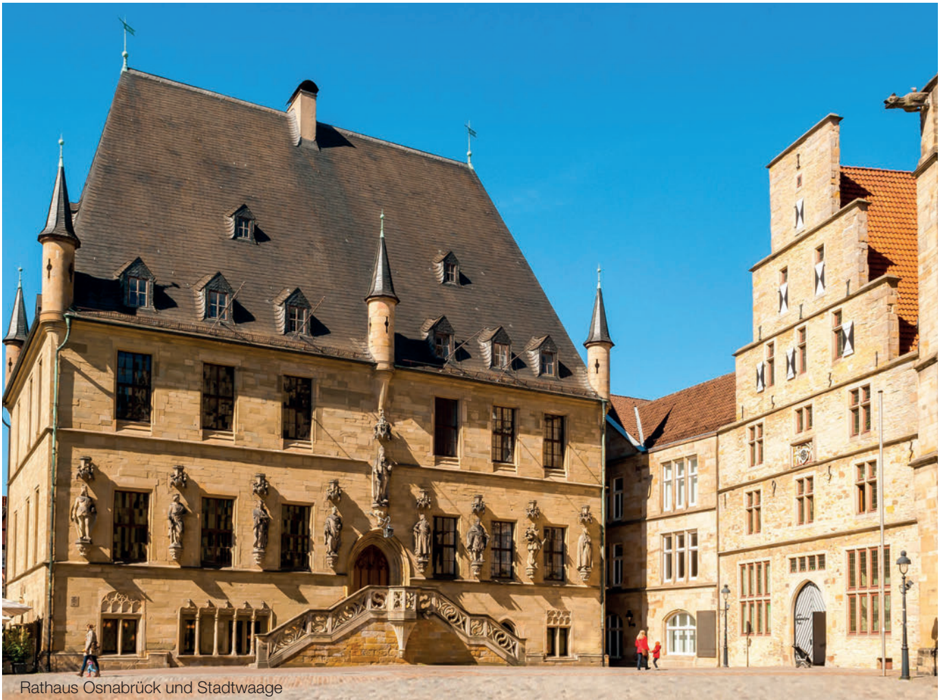
Rathaus Osnabrück und Stadtwaage

stücksbestand der Enkelin Grunderwerbsteuer zu zahlen gewesen wäre. Nunmehr sind sich Rechtsprechung und Finanzverwaltung aber einig, dass die umwandlungsrechtliche Unmöglichkeit des Einhaltens von Fristen nicht zur Versagung der Anwendung der Konzernklausel führt.